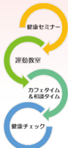
【オレンジカフェの流れ】

認知症の方やそのご家族、地域の方など誰でも気軽に参加でき、安心して過ごせる集いの場所であるオレンジカフェいわみは石見地区の公民館を巡回して開催させていただいています。