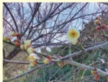
2月7日 香梅苑の梅の花開花

食への興味関心を高め、季節を感じてもらおう取り組みでもあるクッキング。子ども達も楽しみにしている活動のひとつですが、コロナ禍の中で直接食材にふれることができなかつたり、クッキングが中止になることもありました。