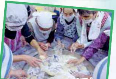
丸める作業はまかせて♪