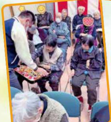
どんな事が書いてあるかな？