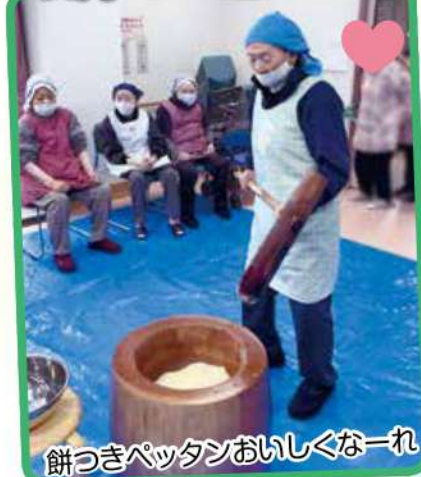
餅つきペタンおいしくな一れ