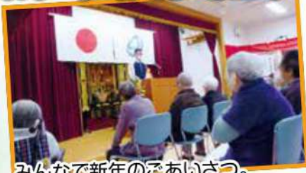
みんなで新年のごあいさつ。