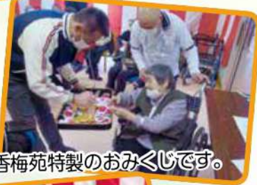
香梅苑特製のおみくじです。