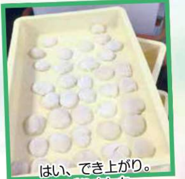
はい、でき上がり。 がんばりました。