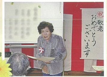
今回は6名の方が表彰を受けられました。おめでとうございます。