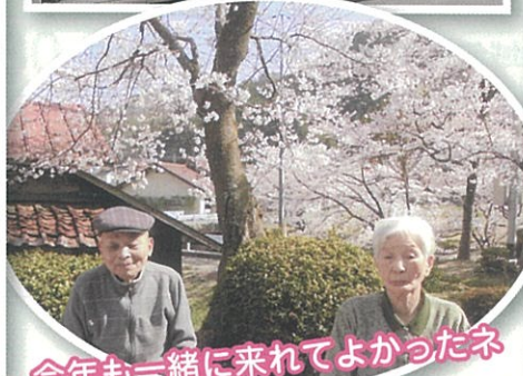
今年も一緒に来れてよかったネ