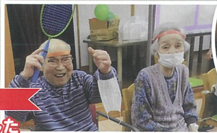
ボール送り 赤組が勝ちました