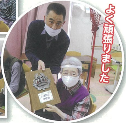
よく頑張りました