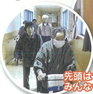
先頭は107才! みんなも頑張るー