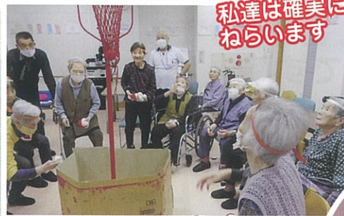
私達は確実に ねらいます