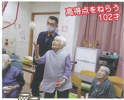
高得点をねらう 102才