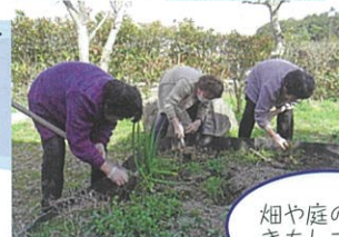
畑や庭の草抜きもしました