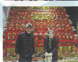
写真の時はマスクをはずしました。