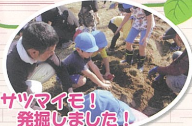
サツマイモ! 発掘しました!