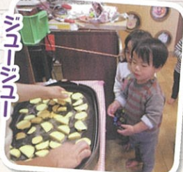
シューシュー 良い音~ いつにない~!