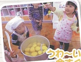
うわ~いいにおい... 今すぐたべたいな~