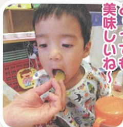
あ~くんバクツ! とっつても 美味しいね!!