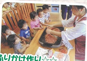
ふりかけ作り☆☆どんな味なのかなあ～??