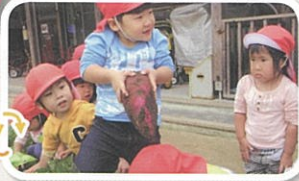
うわあ~いいなあ~ 私もほしいなあ~