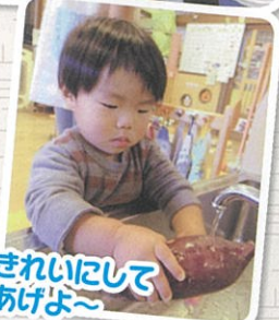
きれいにして あげよ~