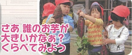
さあ 誰のお芋が 大きいかなあ? くらべてみよう