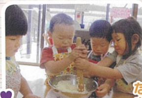
なかなかつぶれないなあ～♪おいしくなあれ～