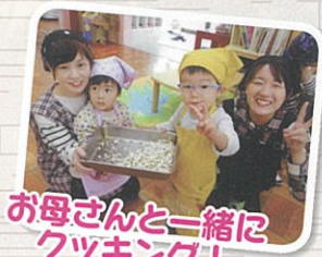
お母さんと一緒に クッキング!