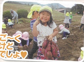
おいもすご～くおもたいけど頑張ったでしょ♡