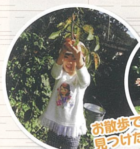
お散歩で 見つけた柿~