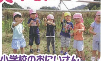
小学校のおにいさん たちの稲刈りを見にいったよ