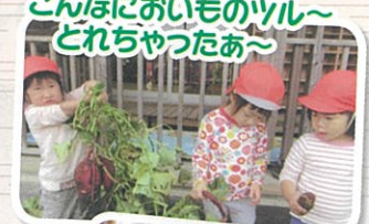
こんなにおいものツル~ どれちやつたあ~