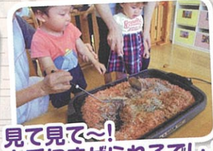
見て見て～! 上手にまぜられるでしょ♡