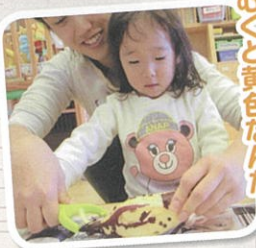
サツマイモの皮を むくと黄色なんだ!