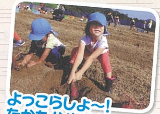
よっこらしよ～! なかなかぬけな～い!