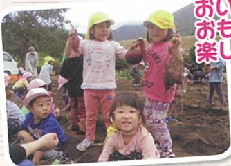
おいもほり～つておもしろくつて楽しいね～