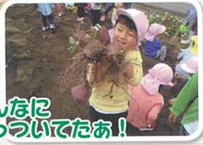
こんなにひっついてたあ!