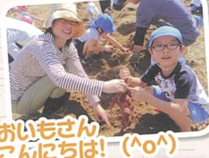
おいもさん こんにちは! (^^)