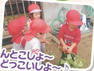
うんとこしよ~ どっこいしょ~♪