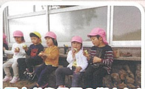
金比羅山から日貫の街をながめ ながら食べるおいもは最高!