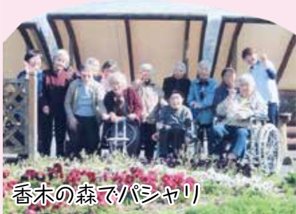
香木の森でパシャリ