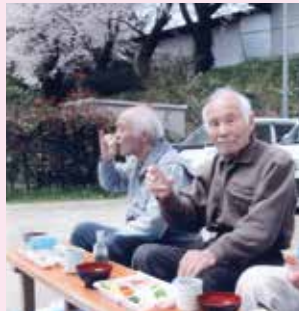
駐車場にてお花見弁当