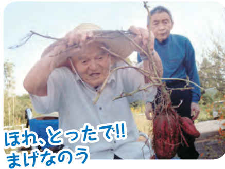
ほれ、とったで!! まげなのう