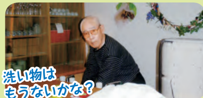
洗い物はもうないかな?