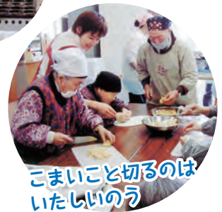
こまいこと切るのは いたしいのう