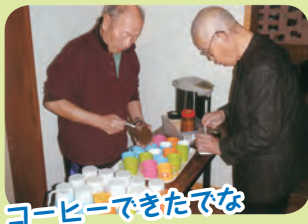
コーヒーできたでな